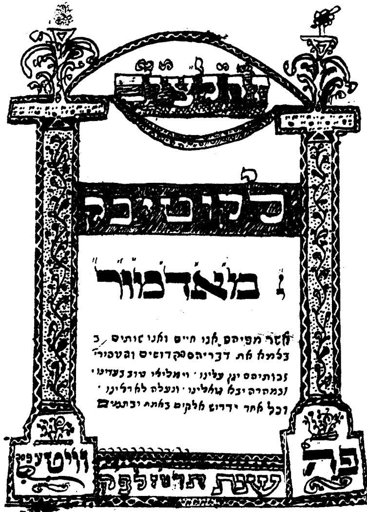
פקסימיליא משער הכתי"י 126 ראה לעיל ע' תרעא