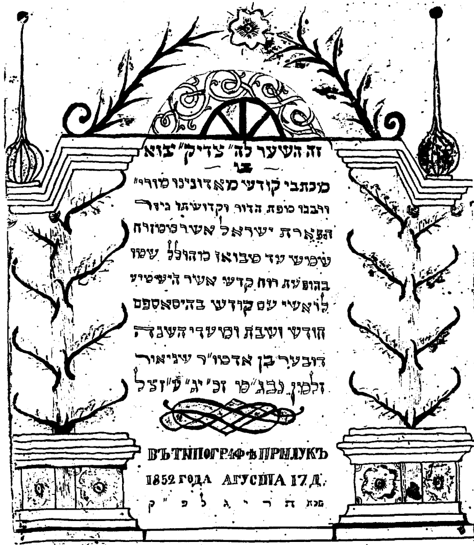
פקסימיליא משער הכתי 2004 ראה לעיל ע' שלח