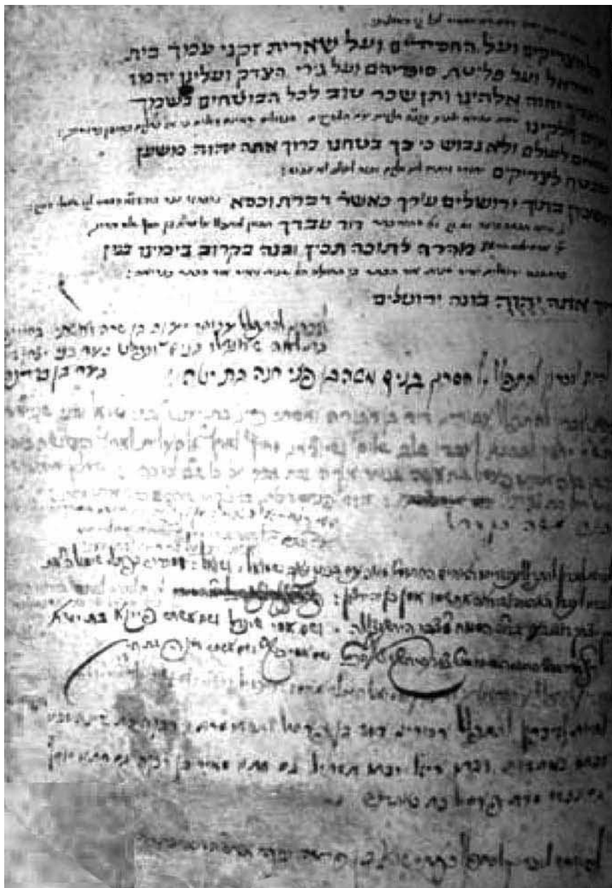
שמות התלמידים המופיעים בסידור לפני ברכת את צמח דוד

חלפו מספר שנים, והסידור הגיע לליובאוויטש, אמנם בהשאלה לתקופה של שבועיים, אבל ההתרגשות גם כך הרקיעה שחקים.