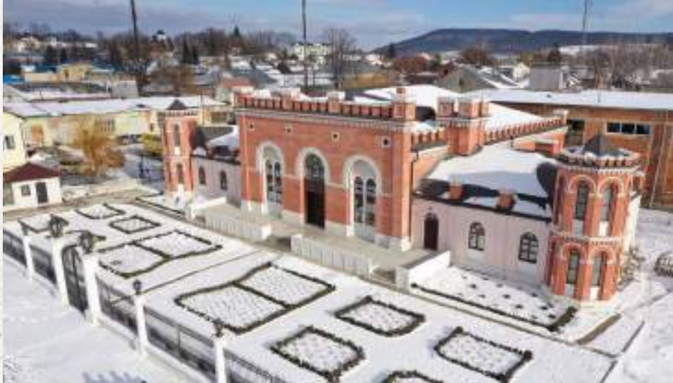
הקלוזי של הס"ק מרוז'ין זי"ע בעיירה סדיגורה