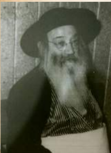
המקובל הגריא"ז מרגליות זצ"ל

מקור אחר לניגון קדוש זה נמצא בספר מגן אבות (באבוב) בשם האדמו"ר הדברי שלמה מבאבוב זצ"ל, שסיפר שמקובל מאבותיו הק' שניגון זה שמע זקינו הרה"ק רבי אליעזר'ל מדז'יקוב זיע"א מאת הרה"ק מרוז'ין זיע"א וכה סיפר, פעם אחת נסע הרה"ק מדז'יקוב להסתופף בצל הרה"ק מרוז'ין, בהגיעו לשם מצא הדלת נעולה והגבאי אמר לו