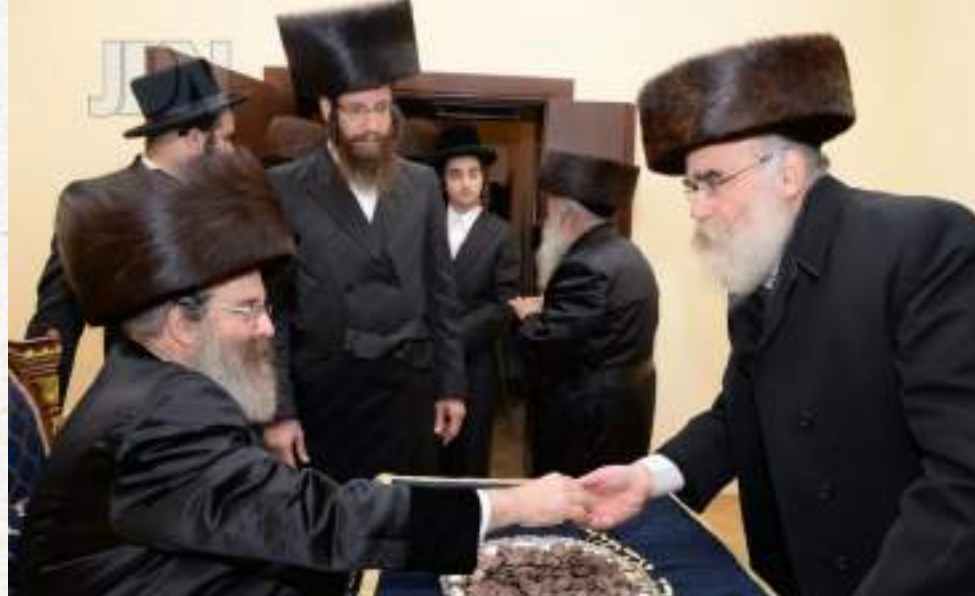
הקלויז של הס"ק מרוזין זי"ע בעיירה סדיגורה

הרפואה שאינה מסכימה לניתוח ללא הארנק המקודש, והנה למרבה הפלא חשה לפתע בחפץ קשיח בתוך הארנק... היתה זו המטבע שחזרה באורח פלא בדיוק כשנצרכה לה! בעלה הקדוש היה נוהג להראות את הכיס עם המטבע לקבל החסידים למען ידעו כוחו של צדיק.