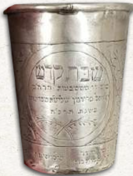
כוס זו ממטבעות הרה"ק ישראל פרידמן מסדיגורה תרנה

מנהג מעניין אודות מכירת המטבעות הייתה מכירתן דווקא לצורך חלוקת "משקה" להתועדות חסידית (כשבדרך אגב אנו נוכחים בחשיבות העצומה שיחסו החסידים גם לעניין זה). לאחר שנרפא הרה"ק ר' אברהם יעקב