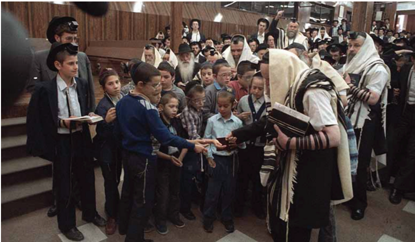
אבי הכלה מקבל ניקל מהרבי, ערב ר"ה תשמ"ז

ואז, באורח פלא, הסתובב הרבי בחזרה לאחור והביט בי, תוך כדי שעמדתי בין כל הבחורים. הרבי פנה שוב אל המזכיר שהגיש לרבי מטבע נוסף, והרבי נתן לי אותה בידו הקדושה.