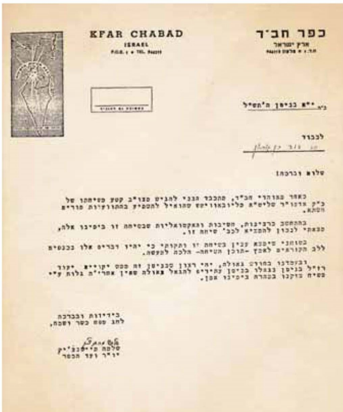
ר' שלמה מיינדצ'יק שולח לבן גוריון את שיחת הרבי אודות מיהו יהודי

בשבת פרשת 'נשא' הגיב הרבי על אלו התמהים על אודות הענין המיוחד בבחירת שזר, והרבי הסביר כי המינוי לגדולה היה על ידי בני ישראל, ובהם עשרות יראי שמים. הרבי הדגיש את מאמר הגמרא - "העולה לגדולה מוחלין לו כל עוונותיו", וסיים