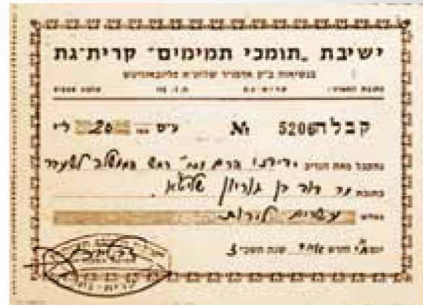
קבלה המעידה על תרומת בן גוריון לתומכי תמימים קרית גת