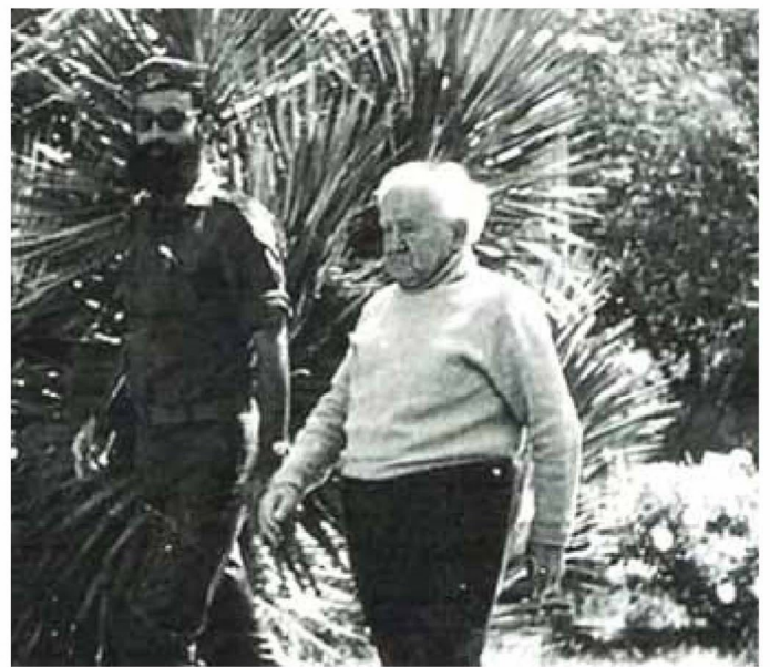
דוד בן גוריון ושומר הראש - התמים טוביה פלס