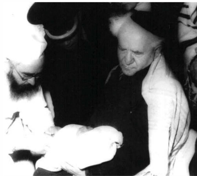
בן גוריון סנדק ולצידו המוהל החב"די הרב יעקב יוסף רסקין

זו הסיבה שיחסה של חסידות חב"ד - ששמה לה מטרה לקרב כל יהודי - אל בן גוריון, היה לא פשוט בבחינת 'חשדהו' וכבדהו', ושוב 'חשדהו'... רשמית, לא היה כל קשר בין חסידות חב"ד לבין בן גוריון; פה ושם נרקמו קשרים שונים שבאו לידי ביטוי בהזדמנויות קצרות, אך לא ניתן לכנות זאת 'קשר קבוע', ובוודאי לא 'ידידות' כפי שהיה עם אישי ציבור אחרים.