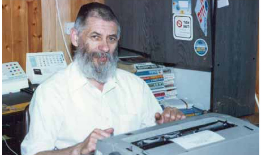
בעבודתו כמזכיר ישיבת הבוכרים

של הדור הצעיר: היום אפילו הקטנטנים מתכוננים ל"א ניסן עם החלטות טובות ומעשים טובים כמתנה לרבי, וכולם מדברים כל היום על הרבי, וגם הם לא ראו את הרבי, "ממש כמוכם, ברוסיה", אמרתי. התגובה של השווער היתה מבט רציני, ולאחר מכן חיוך רחב: