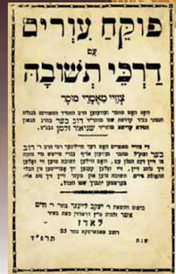
פוקח עורים - מאמרי אדמו"ר המצטעי - מהדורת לאדז' תרפ"ד