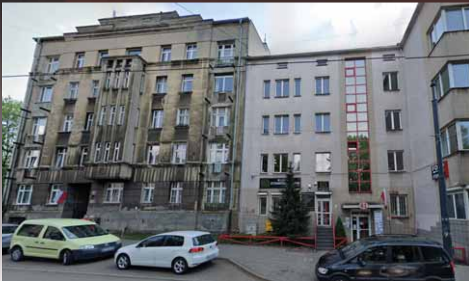
בניין הישיבה ברחוב פאמארסקא A41