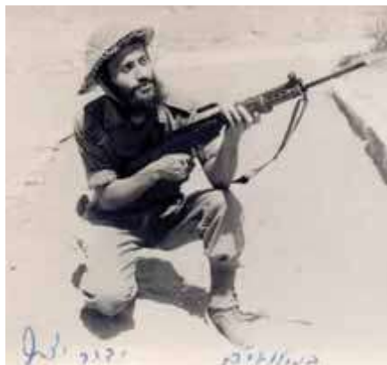
הרב ידגר בצעירותו במילואים, בתמונה שנמצאת בארכיון ספריית הרבי