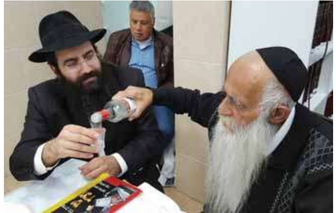
הרב ידגר באמירת 'לחיים' לבבית

והערצה. לאורך כל שעות היום, ולעתים באמצע הלילה, הגיעו אליו אנשים כדי להתייעץ עמו בכל תחומי החיים ולבקש את הדרכתו והכוונתו. בדרך כלל היה כותב יחד עימם לרבי מה"מ.