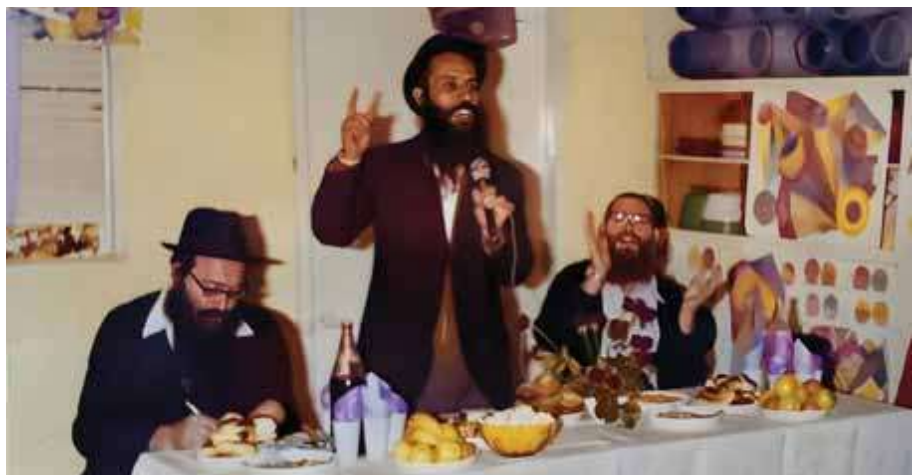
הרב ידגר בצעירותו נואם בהתוועדות

מיוחדת ונדירה, בעל מידות תרומיות, כל כולו אהבת ישראל לכל אדם באשר הוא. אישיותו הייתה לבבית, תלמיד חכם, דרשן מעולה שבדבריו עורר מאות ואלפים להיות יהודים של ממש.