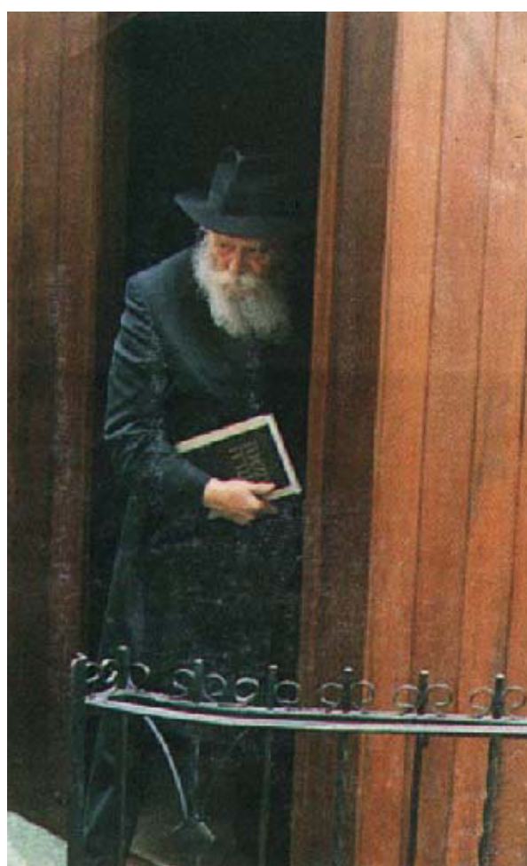
הרבי עם ספר "רמב"ם לעם" בפתח סוכתו