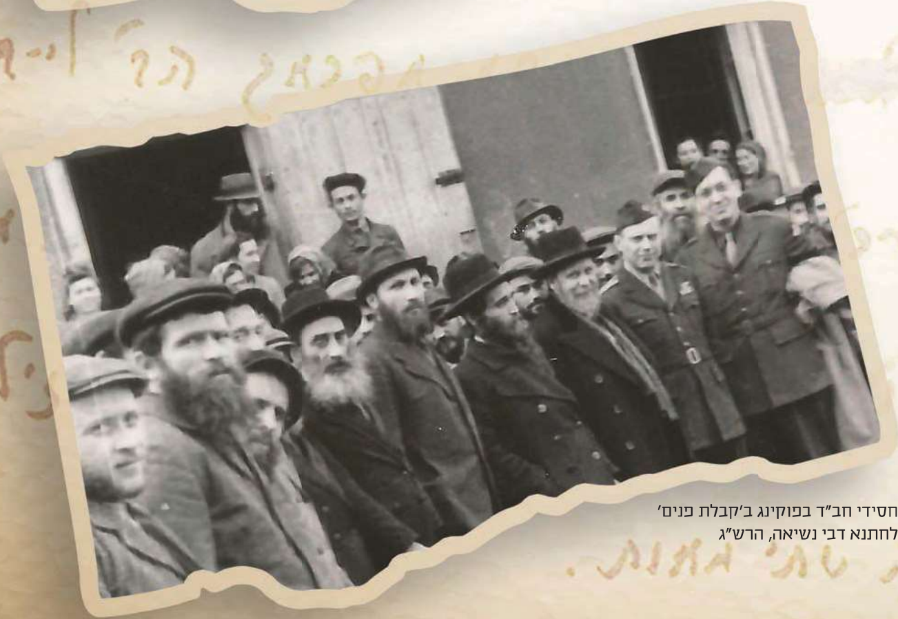
חסידי חב"ד בפוקינג ב'קבלת פנים' לחתנה דבי נשיאה, הרש"ג