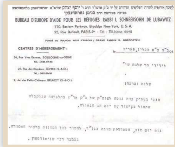
הלשכה לעזרה לפליטים, משגרת לרב שלמה מטוסוב את נוסח מברק הרבי הריי"צ לרגל י"ט בכסלו חג הגאולה

מאידך גיסא - לא היה גבול לשמחתם על כך שהצליחו לפרוץ