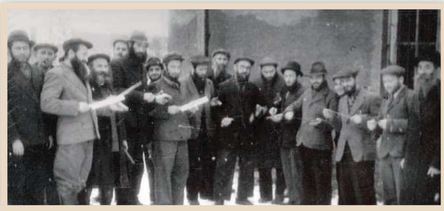
השוחטים עם הסכינים בפוקינג

מעט מעולם לא נכתב או תועד בדברי ימי חב"ד אותו 'מקטע' שהיה קצר, אך רב-משמעות, ברצף ההיסטורי של תולדות מאורעות החסידים.