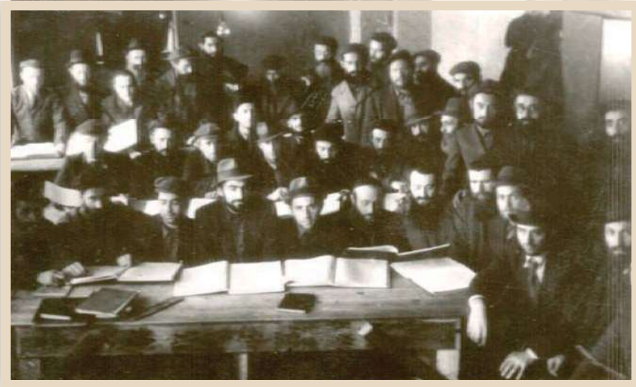
בית מדרש לרבנים ושוחטים שהוקם בפוקינג