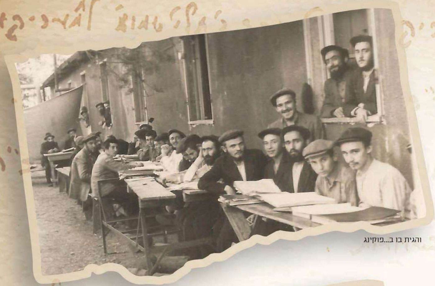
והגית בו ב...פוקינג