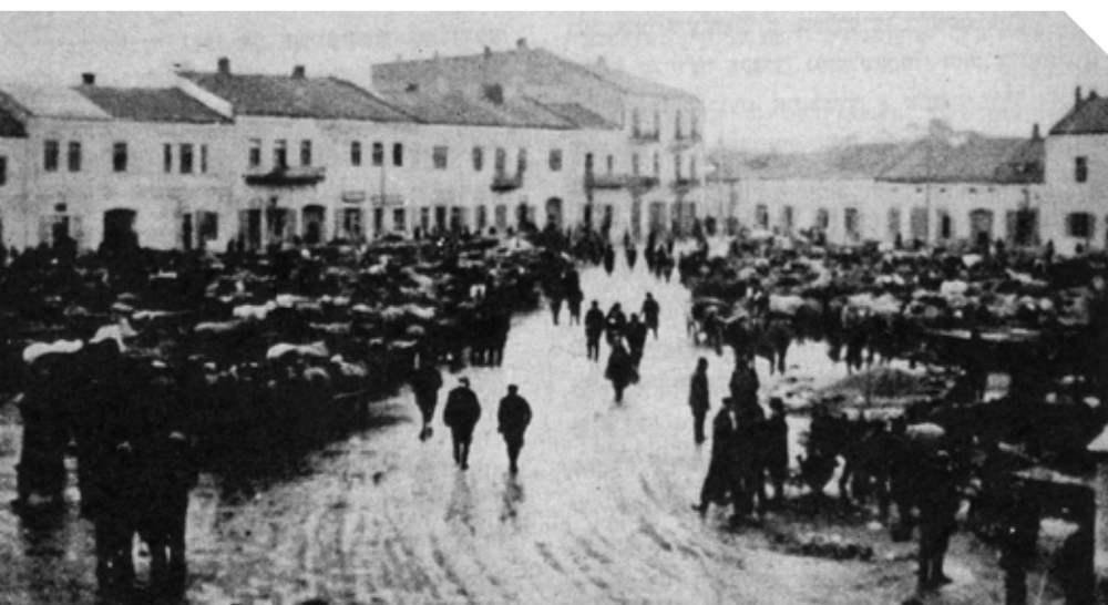
שלוש פעמים באו הגרמנים. יהודי חמלניק נאספים ומגורשים למחנות ההשמדה

ברכבת ולא במטוס. הנסיעה הארוכה ברכבת, עם כמה ילדים שובבים, הייתה מייגעת מאוד. לקליפורניה הגיעו ביום שישי, והבת רחל הציעה להוריה לסעוד את סעודת השבת בביתה ולא ב'בית חב"ד' עם הסטודנטים. "את המפגש איתם תוכל לדחות לאחרי שבת", אמרה לאביה. אבל הוא לא היה מוכן אפילו לשמוע. "לא באתי לכאן בשביל לנוח", אמר לבתו. "אני רוצה לפגוש את הסטודנטים ולהשמיע באוזניהם דברי תורה".