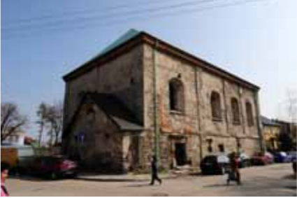
כעשרת אלפים יהודים. בית הכנסת האחרון ששודר מלפני השואה ועדיין עומד על תילו בחמלניק