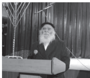
נואם בחגיגת חנוכה בקישינוב