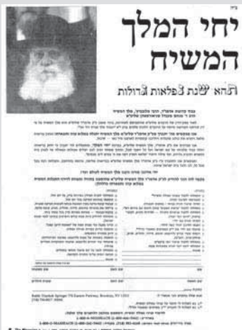
המודעה בלשון הקודש

ברור ומוכן. יתירה מזה, אנו רואים שבעיני הרבי פירסום מודעות בעיתונות הוא בפירוש "אופן המתקבל"!