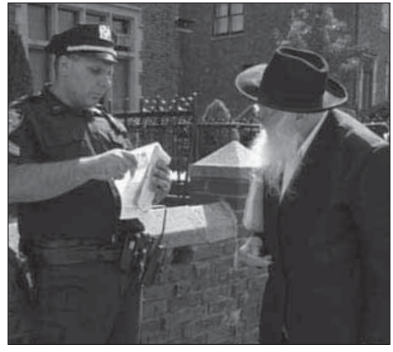
מבצעים גם עם "בני נח"