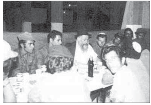
תשמ"ב. עם חיילי צה"ל בגבול סוריה-לבנון