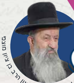
על פי תשובות הגאון הרב בציון ציון