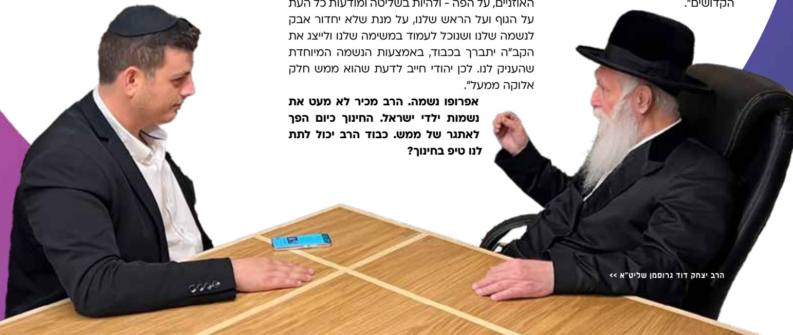
הרב יצחק דוד גרוסמן שליט"א <<

"זו המציאות. המקור לזה הוא בזוהר הקדוש, ובעל התניא מדגיש את זה יותר. אנשים חושבים שיש 'דומם', 'צומח', 'חי' ו'מדבר', ויהודי הוא חלק מה'מדבר'. אלא שזו לא המציאות. יהודי הוא מעבר ל'מדבר'. ביהודי יש חלק מיוחד לו הוא זכה מאת הקב"ה בזכות אבותינו הקדושים".