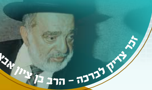
זכר צדיק לברכה - הרב בן ציון אבא שאול

חכם בן ציון היה מוסר שיעורים מדי יום ומזכה את הרבים. חיבר בחייו ספרים רבים, והמפורסם שבהם הוא שו"ת "אור לציון" בו הוא משיב על שאלות הלכתיות יומיומיות.