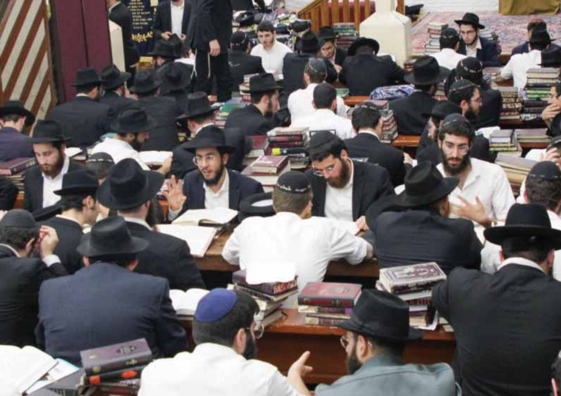
תלמידי התמימים שוקדים על לימודם ב-770 בית משיח

התכנים לא רק שהם מותאמים ליראת שמים וליהודי דתי, אלא גם מותאמים לתמימים. אנחנו לא מקדימים את המאוחר. מה שצריך לשמוע רק אחרי החתונה, בקורס הוא לא ישמע.