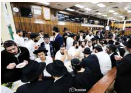
התוועדות ליל שישי