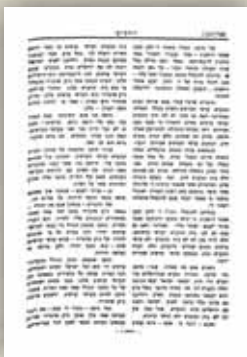
'הנה ליובאוויטש הוא ירושלים שלנו' גליון התמים חוברת ב'