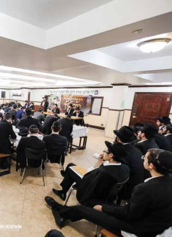
פתחת פרויקט 'יששכר זבולון'