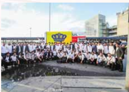
ההגעה לקבוצה

בנים המשיבים והקשובים יש זכויות נפלאות בש- מירת הסדרים של מאות תמימים!