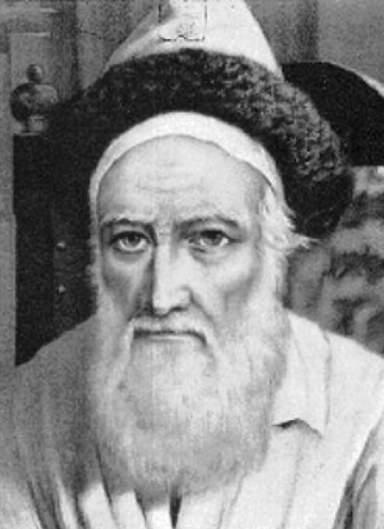
ציור פני קודשו של כ"ק אדמו"ר הצמח צדק