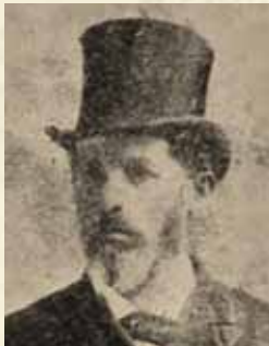
הרב ווידרביץ בתקופת כהונתו בארצות הברית