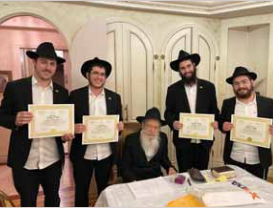
ראש הישיבה בחלוקת תעודות סמיכה לתלמידים 770