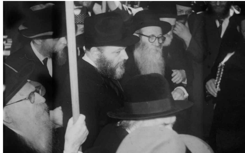
הרבי מסדר קידושין בשנת תשח"ו