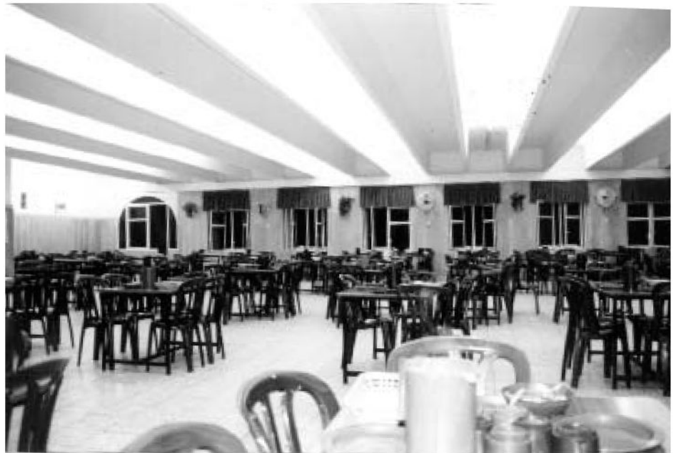
חדר-האוכל המפואר של המוסדות

כתיבת סת"ם עמדו כבר בהצלחה בבחינות של 'משמרת סת"ם', וכשתלמידים מתלבטים יראו שתלמידים מהישיבה שלנו הצליחו להוציא 'סמיכה' אצל רבנים ידועי שם — לא יירתעו מלהרשם לישיבה.