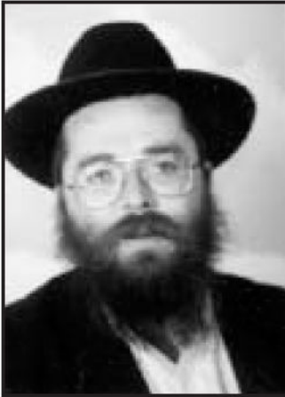
הרב מנחם מענדל גורביץ משפיע הישיבה-גדולה