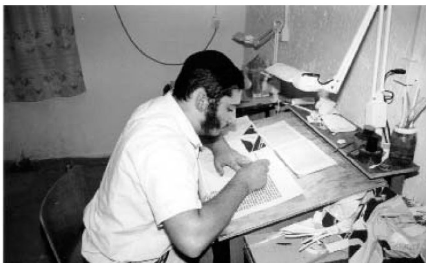
אחד התמימים בלימודי הסופרות

זאת ועוד, גם מצד התלמידים עצמם, הרי מדובר בתלמידים שרגילים וצריכים לקבל עדיין יחס אישי וטיפול אינדיבידואלי, דבר שלא יכלו לקבלו בשום ישיבה. כך גמרנו כל שנה עם תחושה של החמצה, כאשר תלמידים ששנתיים טיפחנו בהם את הרצון ללמוד