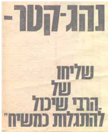
כותרת הכתבה בעיתון 'מעריב', תשל"ד