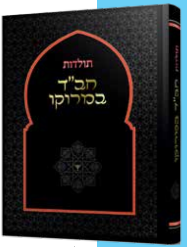
"תולדות חב"ד במרוקו" שער הספר החדש

ולספר הייחודי, יש מבוא מיוחד; הגאון הגדול, הראשון לציון ורבה של ירושלים הרב שלמה משה עמאר שליט"א , אשר בצעירותו שקד על לימוד התורה בישיבת חב"ד בקזבלנקה – עיין בעלים מן הספר טרם ראה אור וצירף מבוא מיוחד בו מעלה על נס את פעילות שלוחי הרבי יחד עם אדמו"רי וחכמי מרוקו.