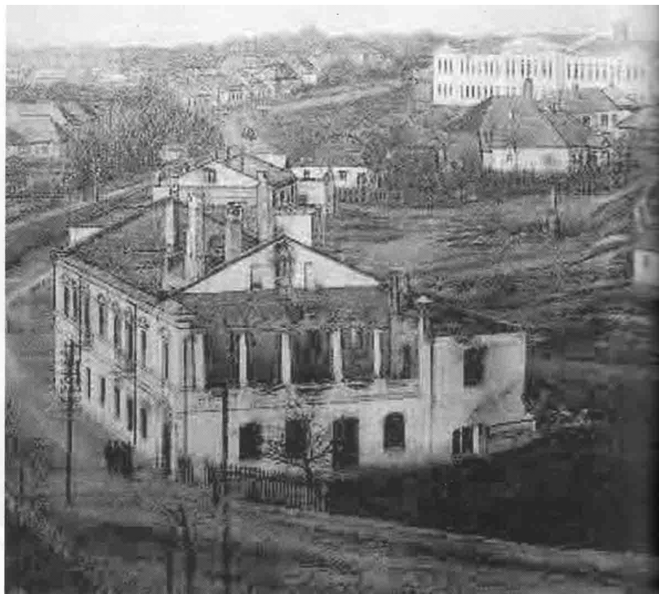
מימין: העיר לודמיר. התמונה צולמה בשנת תרע"ה. משמאל - למעלה: בית כנסת בלודמיר (תרע"ז). למטה: התלמוד תורה לו סייע הרב טקץ'

מוכן לדפוס לא לפני שקיבל עליו הסכמות מגדולי הרבנים ובהם: הרב ז'וד יאקובסאהן מו"ץ דליובאוויטש, הרב וואלף קאזעוויניקאו רבה של יקטרינוסלב והרב יהודה לייב צירלסאהן רבה של קישנב (לא ברור אם יש קשר משפחתי). ספרו מורכב משני חלקים: בחלקו הראשון ביאורים ותשובות בשולחן ערוך יורה דעה הכולל ביאורים בדברי אדמו"ר הזקן וה'יצמח צדק' ובסופו דרוש. בחלק השני חידושים על פי חלקי התורה פרד"ס ומוסר.