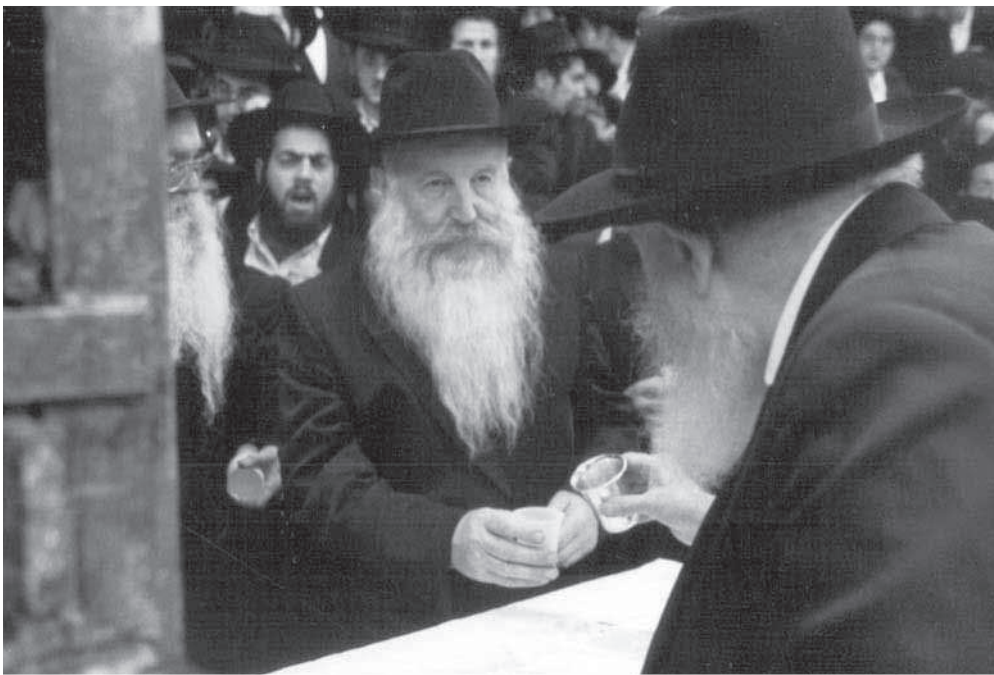
ב'כוס של ברכה'

”כאשר הגיע לראשונה לרבי לקראת חודש תשרי תש”ל, נכנס ל'יחידות' ומסר לרבי את ספר התורה הישן. הרבי לקח את הספר בידיו, יצא מחדרו הק', ירד ל'זאל' הגדול והכניס את הספר לארון הקודש...”