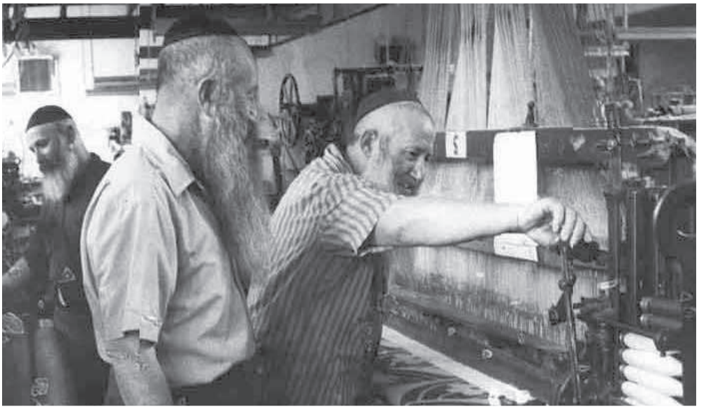
(במרכז התמונה) במפעל גולגוטקס שהוקם בהוראת הרבי