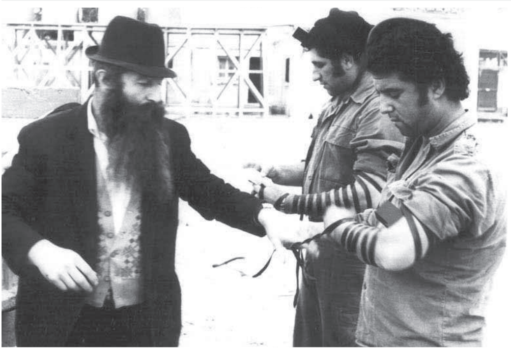
במבצע תפילין בחצי האי סיני, חנוכה תשל"ג