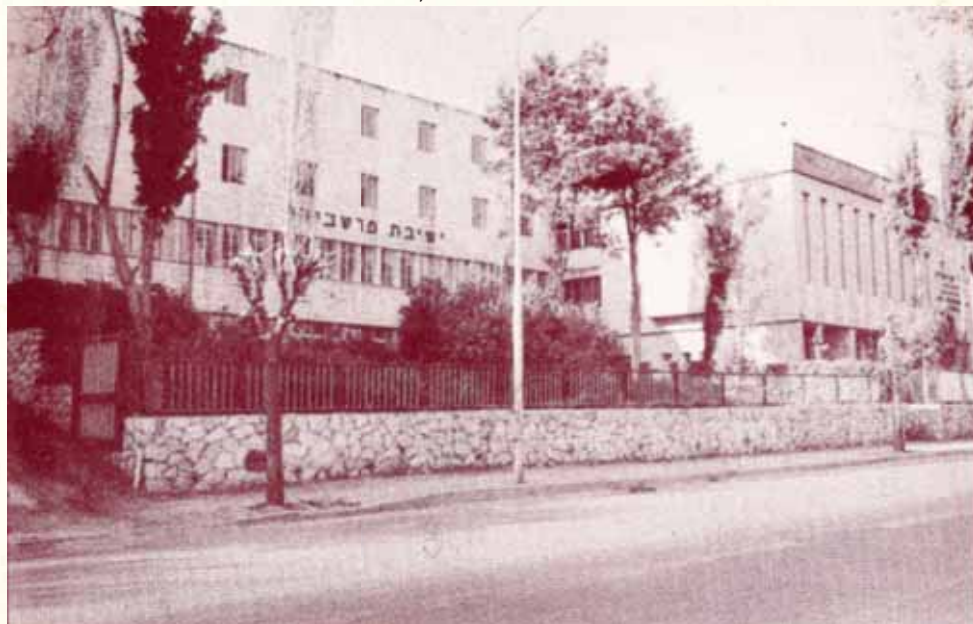
בנין מפואר לד' ולתורתו. בנין ישיבת פרשבורג בשכונת גבעת שאול