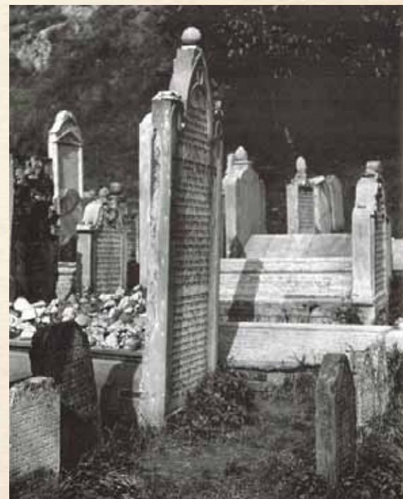
מקום אש להבת שלהבת. מצבת ציונו של מרנא החתם סופר ז"ע בתצלום נדיר משנת תרצ"ה

בדרשותיו (דף לט) מבאר רבנו בדרך התעוררות את לקיחת ארבעת המינים. את דברות קודשו נביא בלשונו הטהורה, כשבין