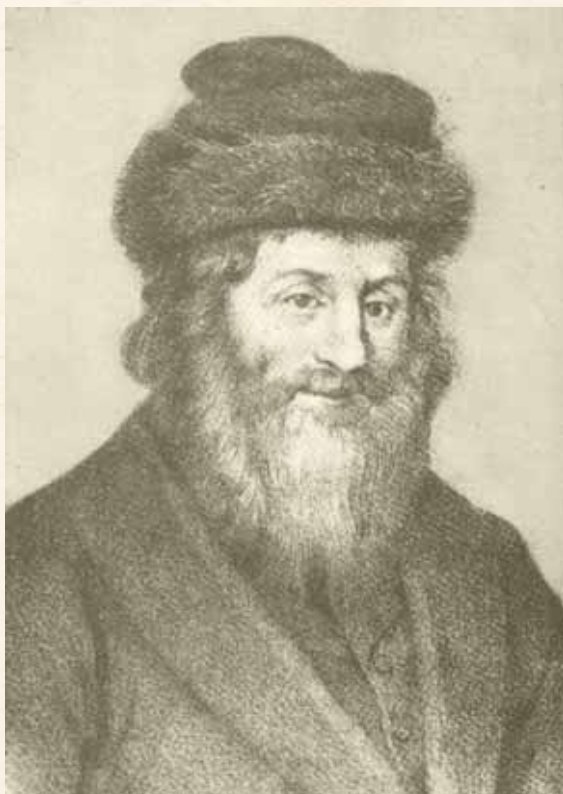
משה רחמימא. דמות קדשו של מרנא החתם סופר ז"ע

אוצרות ארבעת המינים, חול המועד, הושענא רבה ושמיני עצרת, מתורתו של רבנא משה איש האלוקים מרנא החתם סופר ז"ע לרגל יומא דהילולא קדישא | כ"ה בתשרי