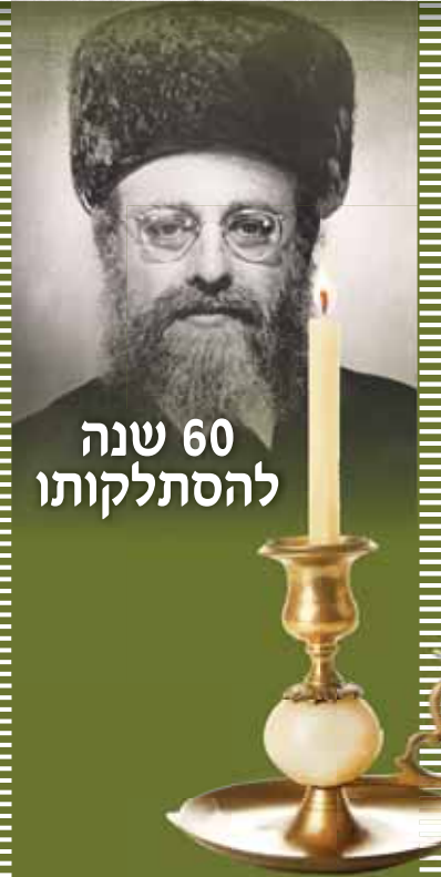
60 שנה להסתלקותו