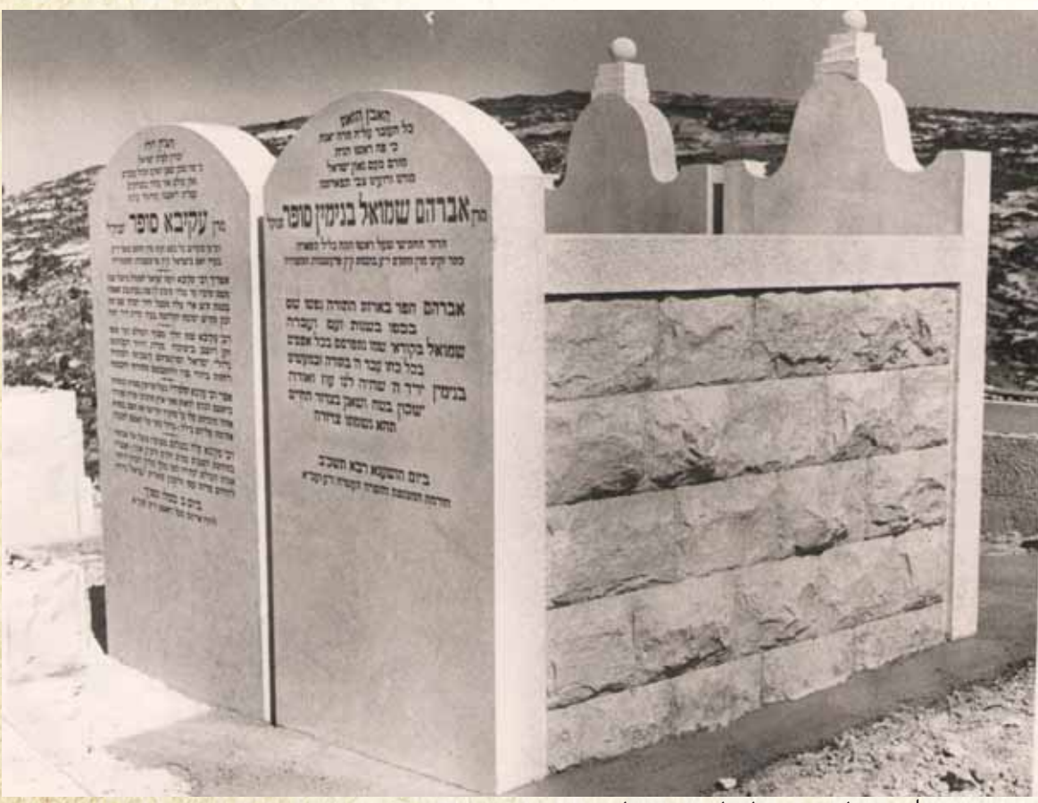
מצבותיהם של מרן ה'דעת סופר' וה'חשב סופר' בהר המנוחות