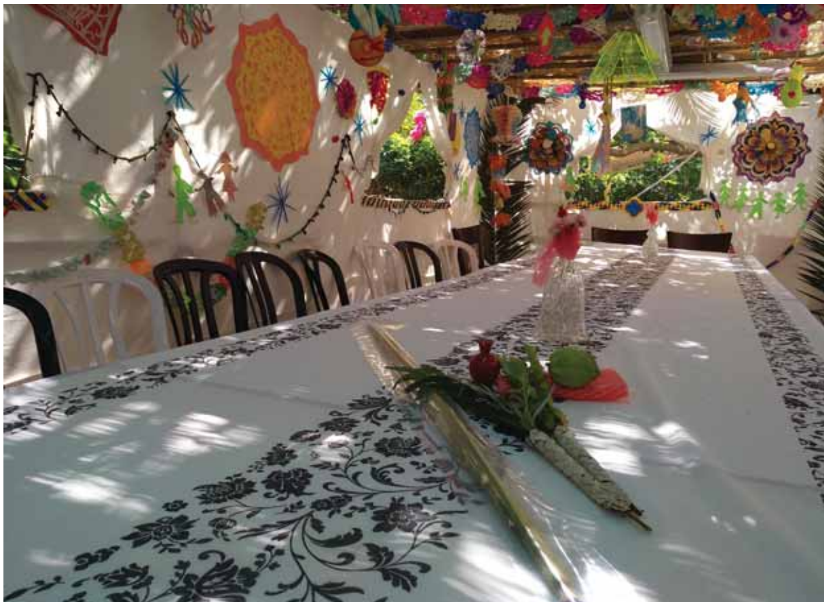
בצל כנפיק יחסון. נוי סוכה (אילוסטרציה)

ובספר "דרכי חיים ושלום" (אות תשל"ו) מביא: [ביום ו' דעשיית"ת היה דרכו בקודש של הרה"ק ממונקאטש לדבר מעניין הסוכה ותיקונה, ואמר כי מה שאומרים באותו יום בסליחות "יחביאנו צל ידו תחת כנפי השכינה" מקובל מבעל 'עטרת צבי' זי"ע שזהו קאי על הסוכה, שחופפת עלינו ומצלת ומגנת על כלל ישראל, ומעוררים זכות מצות סוכה הקדושה שמעלתה מרומם מאוד, לצרף לזכותנו ולישועתנו], ואמר שמקובל בשם תלמידי הגה"ק מראפשיץ זי"ע שהי' דרכם בקודש לעשות ציורים ופרחים וכעין צפורים וכיוצא