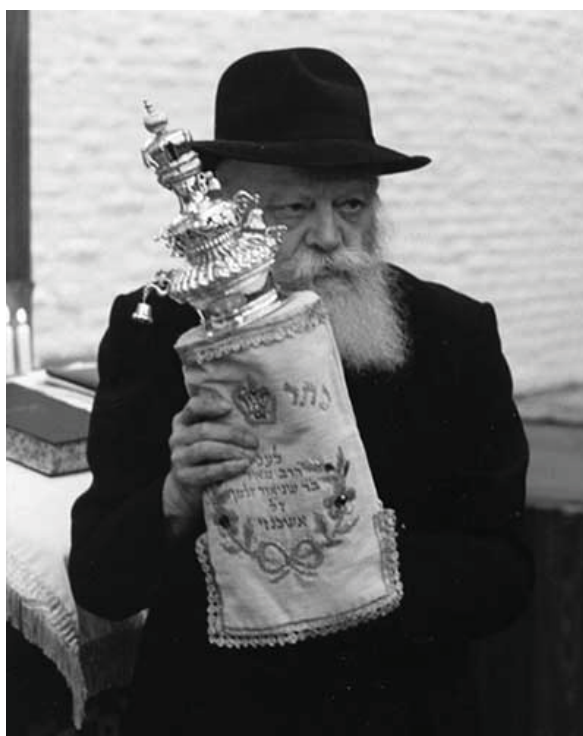
כ"ק מרן אדמו"ר מליובאוויטש ז"ע עם ספר תורה

תחילה הוא מביא מהמהרי"ק שני ביאורים לתיבת 'חתן', האחד שמקור השם חתן הוא בזמן החופה ולא קודם (ומה שנקרא כיום חתן