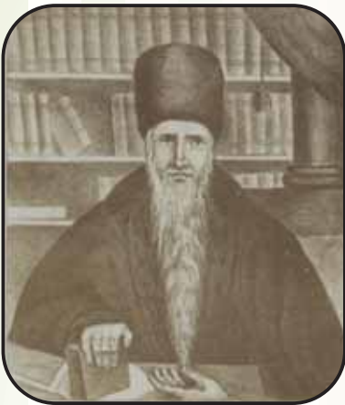
ציור דמותו של רבינו