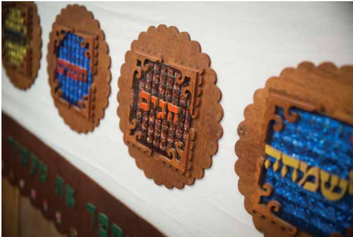
לעשות עם כל ההידורים. נוי סוכה (אילוסטרציה)

דירתו לפיכך התיירו לגבי סוכה כן. לפי שאין אלו לעיקר סכך אלא להתנאות ולהנעים עליו ישיבת סוכה ומצוה. ולא עוד אלא שהוא מצוה מן המובחר העלות שם כליו הנאים לחבב את המצוה ושתהא דירתו ערבה... עכ"ל.