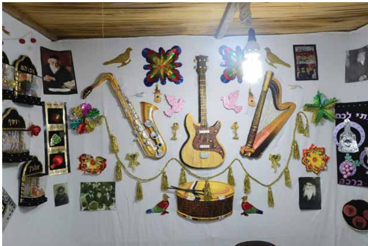
נוי סוכה להנעים הישיבה בה. נוי סוכה (אילוסטרציה)

כיוצא בזה בספר "סדר היום" (מצות סוכה): "מדקדקים לנאותה בכל דבר נאות לה, וזה עיקר בכל המצוות שיהיה האדם שמח וטוב לב לזכות בעשייתה, עד שמפני כך עושה בה תוספת טובה יותר ממה שנצטווה מפני חבוב המצוה, ובוה יש לו שכר אחר נוסף על שכר עשייתה".