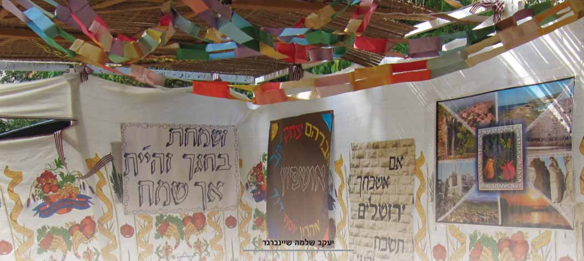
יעקב שלמה שיינברגר