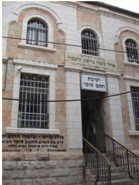
שומרי החומות. בנין ישיבת 'חתם סופר' בשכונת בתי אונגארין בירושלים והכולל שהוקם לזכרו של רבנו