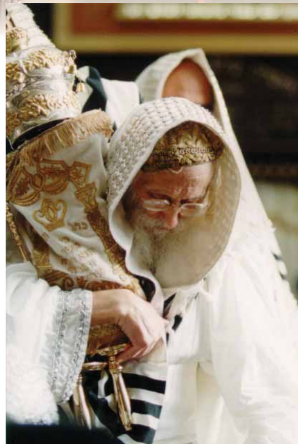
כ"ק מרן אדמו"ר ה'דברי שלמה' מבאבוב בריקוד עם ספר תורה

הוא כותב בלשון קשה מה ראו עיניו: "אנכי משלומי אמוני קהלתנו הבא על החותמת מודיע לכל רואי כתיבתי זו עם חתימתי מטה, כי ראיתי אשר לא כדת בעיר צלמי בזיתי וזה חזיתי ואספרה. כי חדשים מקרוב באו לא שערום אבותינו ובימי החג הנהיגו למכור המצוה הנקראה בשם חתן התורה, וכרוזא קרי בחיל כל הרוצה ליטול יביא דמים יטול, ומכריזין החתנים בקול המולה גדולה, מי האיש החפץ בחתונה יעלה בדמים, ותעבור הרנה במחנה וכיון שנתן רשות לקונה שוב אין מבחין בין חכם לעם הארץ ובין צדיק לרשע, והיה כצדיק כרשע, כנער כזקן כנקלה כנכבד כטוב כחוטא, הנשבע כאשר שבועה ירא. ורבים מעמי הארץ מתייר"ים ומשתררים ובורים גמורים ונערים שמנוערים ואפילו מקריאה בעלמא ודעתם קצרה קופצים בראש ויהבו ממונא וקיימי, ונעשים חתני תורה ויולדו על ברכי הג'ר שפחה זרה, ותהי שרי עקרה... יש מהם אנשים בלי שם וחושבים לקנות להם שם, וגונבים דעת הבריות מראים תומה ותחתיה טומאה מראים נפש נהדרת ותחתיה תעמוד הבהרת, אין א-להים כל מזמותיהם, וקופה של שרצים