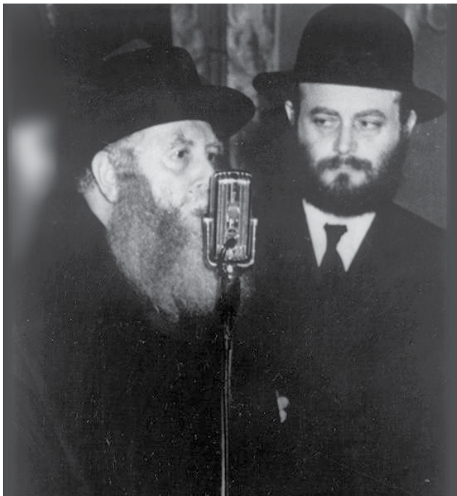
כי בא השמש וזרח השמש. כ"ק אדמו"ר ז"ע במחיצת חותנו, כ"ק אדמו"ר הרי"צ ז"ע